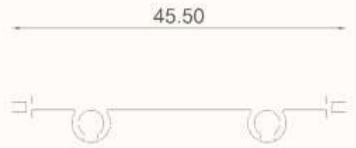
Polikarbonat Led Sürgü (36 WATT)

* TUNÇ PLAST, gerekli gördüğü uygun deđişlikleri önceden bildirmeden yapma hakkına haizdir.