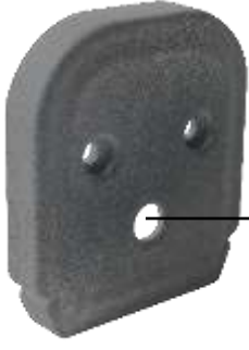
PG7 Rekor Deliđi

Moblen Hammadeden üretilen Delikli Yan Kapak